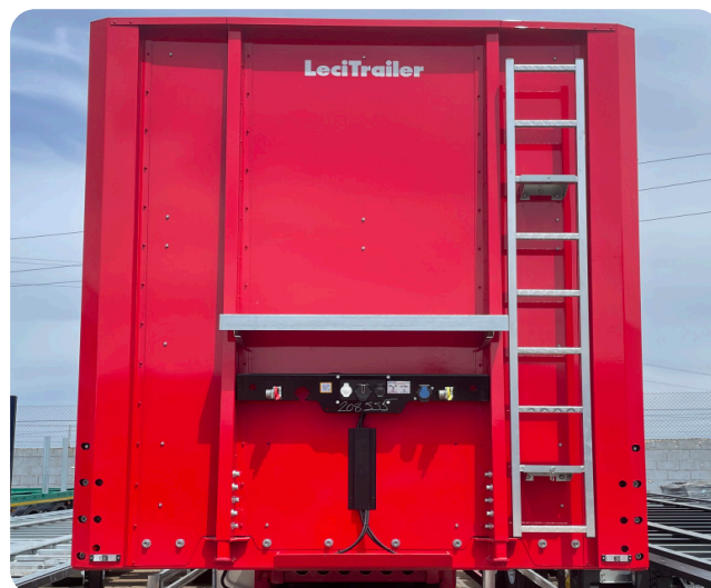
Frontal aparafusado, com escada frontal e resguardo de conexões