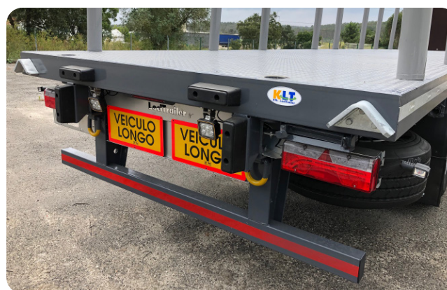
Escada traseira retrátil, argolas de desatolamento, luzes em LED